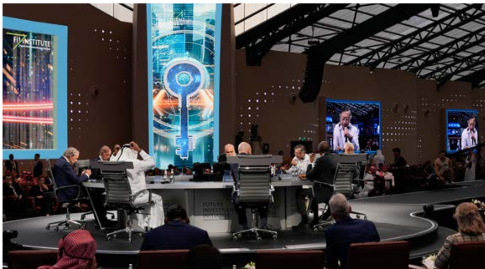
El presidente de los colombianos, Gustavo Petro Urrego, participando en el panel Iniciativa de Inversión en Arabia Saudita.

El presidente ha argumentado que el uso de misiles y acciones militares contra lanchas rápidas en el mar es una política fallida que sólo resulta en la «muerte de personas pobres o migrantes», sin dismantelar las estruc-