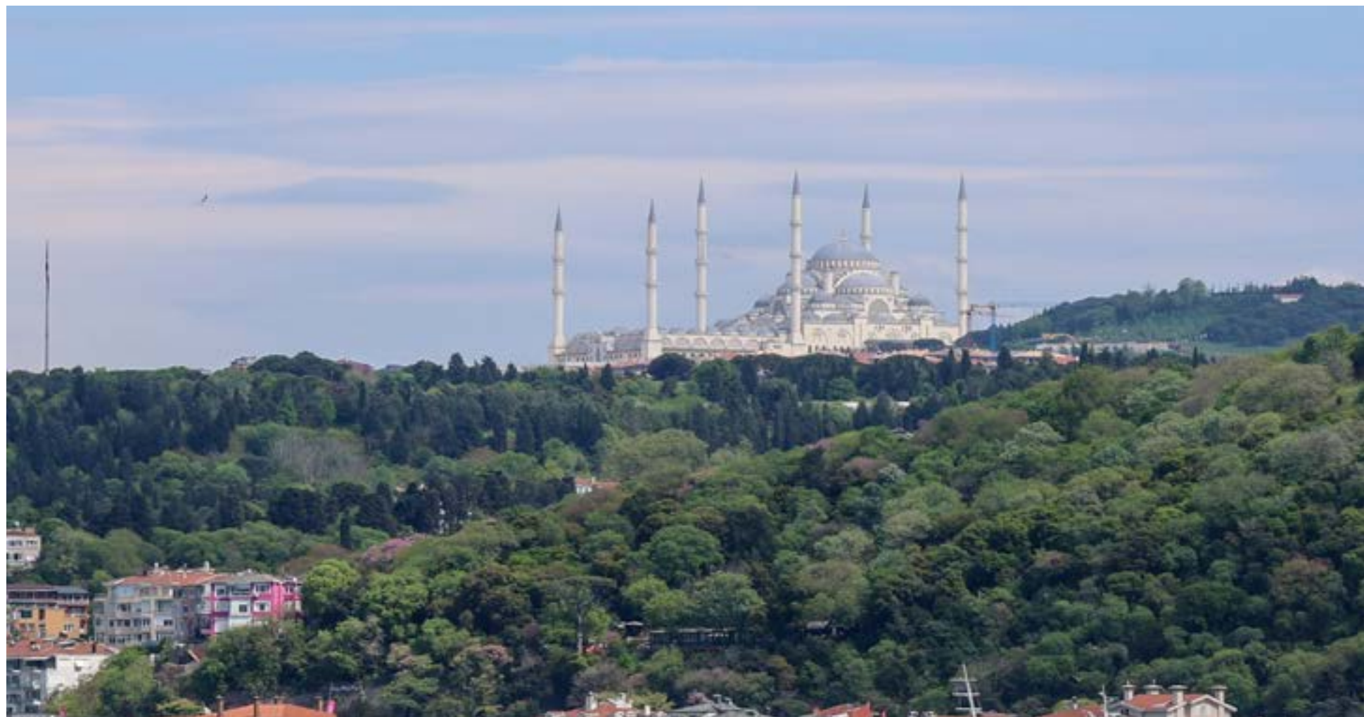
Esta es la mezquita más grande de Türkiye, ubicada en la colina de Çamlıca, en la parte asiática de Estambul.

nes «en términos estratégicos, políticos y económicos».