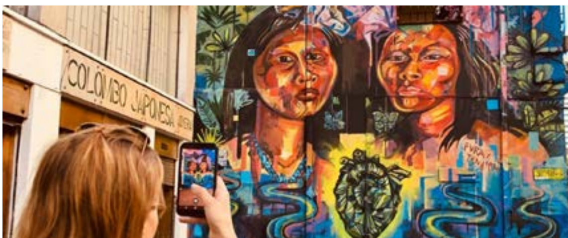
Arte en las calles de Bogotá

lle 75. Comuneros. Avenida Chile. Av. El Dorado. Campín – Universidad Antonio Nariño. Universidad Nacional. Ricaurte. Paloquemao. NQS – Calle 30 Sur. NQS – Calle 38A Sur. General Santander. Troncal Sur. Venecia. Centro Comercial Paseo Villa del Río. Troncal Norte. La Castellana. Troncal Suba. Av. Suba – Calle 116. La Campiña. Humedal Córdoba. Suba – Av. Boyacá. Suba Transversal 91. Troncal Carrera 10. Bicentenario. Primera de Mayo. Ciudad Jardín. Museo Nacional. Troncal Avenida El Dorado. Ciudad Universitaria- Lotería de Boyacá. Recinto Ferial. Gobernación v. Rojas – UniSalcediana. Quinta Paredes. Salitre – El Greco. CAN – British Council. Normandía. Centro Memoria. Concejo de Bogotá.