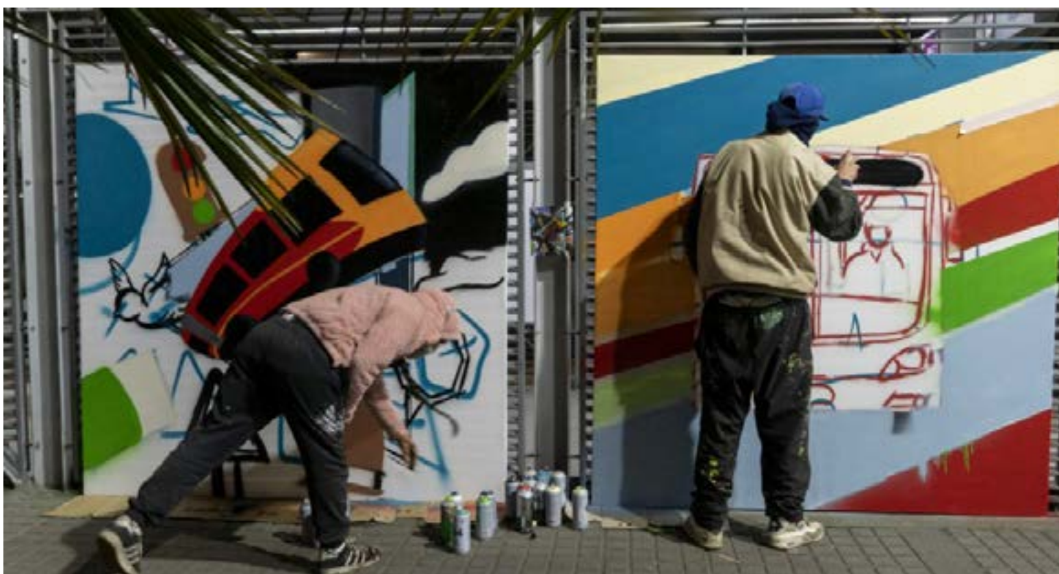
Exposición de 41 artistas y muralistas ganadores de la convocatoria «Ensayos sobre la felicidad en TransMi»