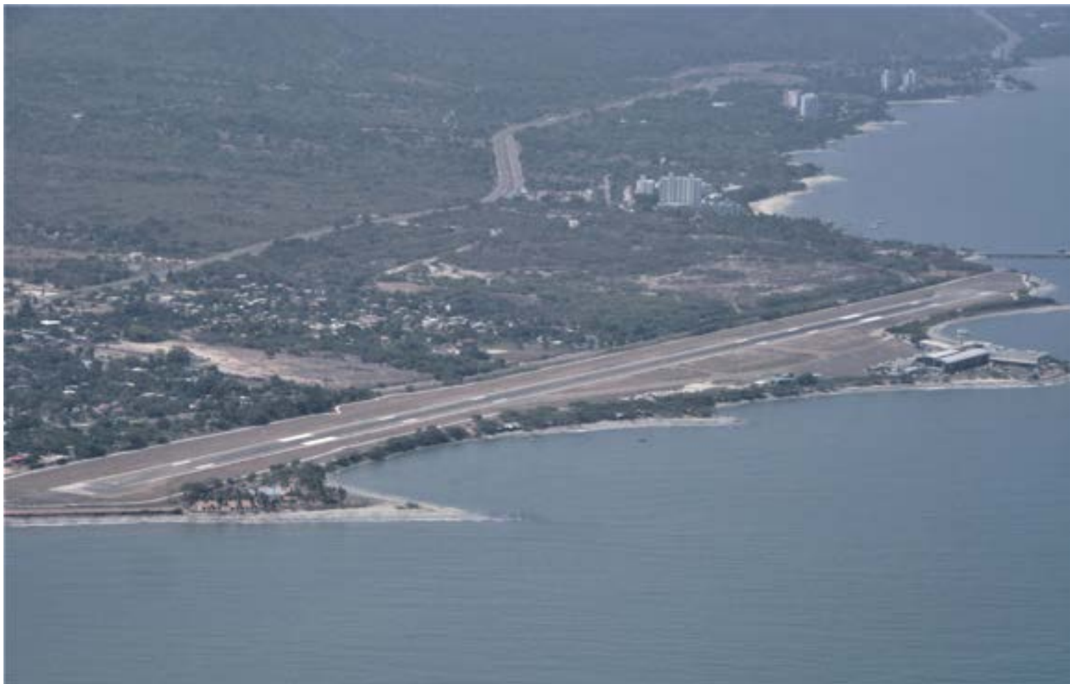
Pista de aterrizaje del Aeropuerto Simón Bolívar de Santa Marta

La conectividad aérea se complementa con proyectos viales aledaños, como la ampliación de «un tramo de 1,8 km de la vía de acceso al terminal aéreo» que adelanta la Alcaldía, asegurando que el Aeropuerto Simón Bolívar se consolide como una moderna y eficiente «puerta de entrada al Caribe colombiano».