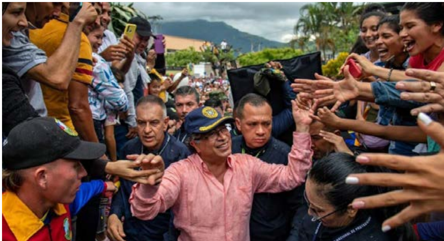
Colombia solidaria con el presidente Petro