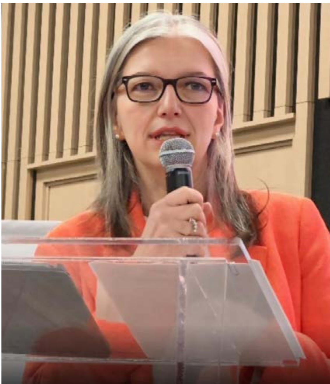
Beste Pehlivan Sunde, Embajadora de Türkiye

Sun comenta que la Fundación Maarif de Türkiye (TMV, por sus siglas en turco) en Colombia «ofrece oportunidades importantes a los colombianos que quieren aprender turco» y que, «en términos académicos, realiza actividades de cooperación con muchas univer-