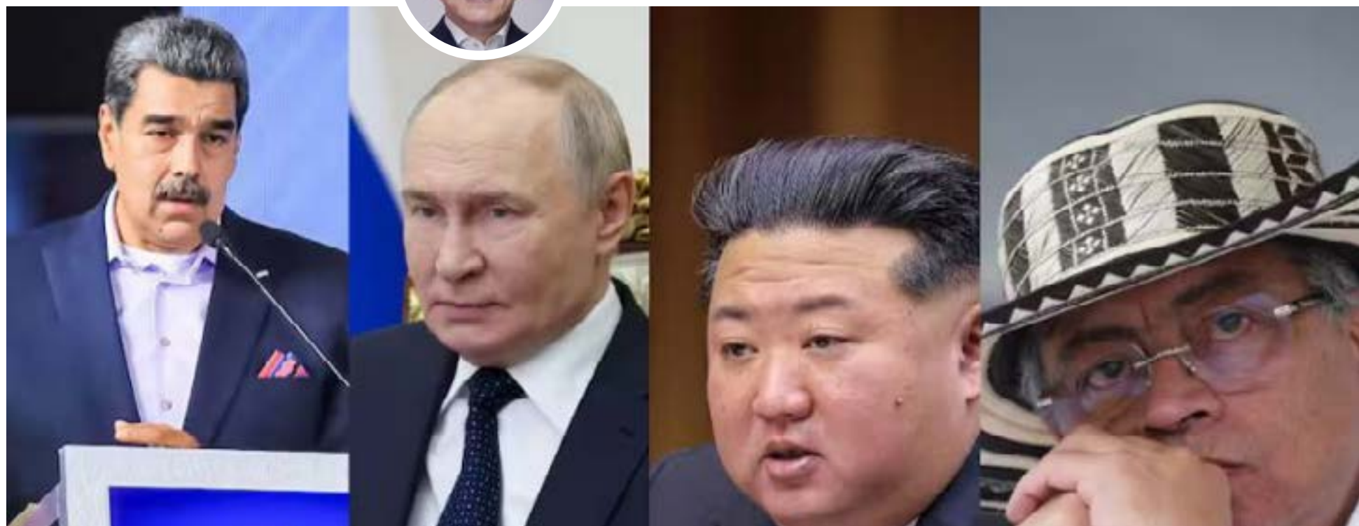
Líderes mundiales Nicolás Maduro, Vladimir Putin, Kim Jong-un y Gustavo Petro, incluidos en la lista Clinton por el presidente de los Estados Unidos, Donald Trump.

L a inclusión del presidente de la República en la Lista Clinton constituye la mayor crisis de legitimidad del Estado colombiano en tiempos recientes. Ningún hecho resume mejor el colapso ético e institucional que hoy sacude al país. El nombre de quien ostenta la máxima magistratura aparece ahora en el mismo registro en el que Estados Unidos agrupa a los señalados de tener vínculos con el lavado de activos y el narcotráfico. Este acontecimiento no es una simple disputa política, sino una declaración internacional de desconfianza hacia Colombia.