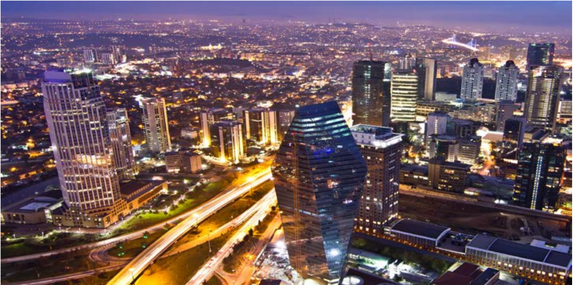
El distrito financiero de L'event en Estambul, la ciudad más grande y el principal centro económico de Turquía.